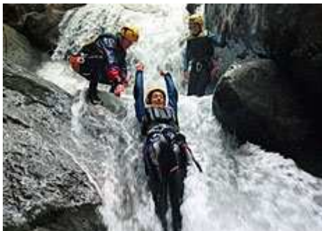
Au Secours!

Télévision Suisse Romande (TSR) Emission du 02 décembre 2007, 12:20 [14:44 min.]